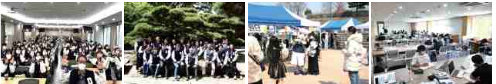
2022학년도 신입생 과점퍼 수여식 경영관 정원에서 함께 한 교직원